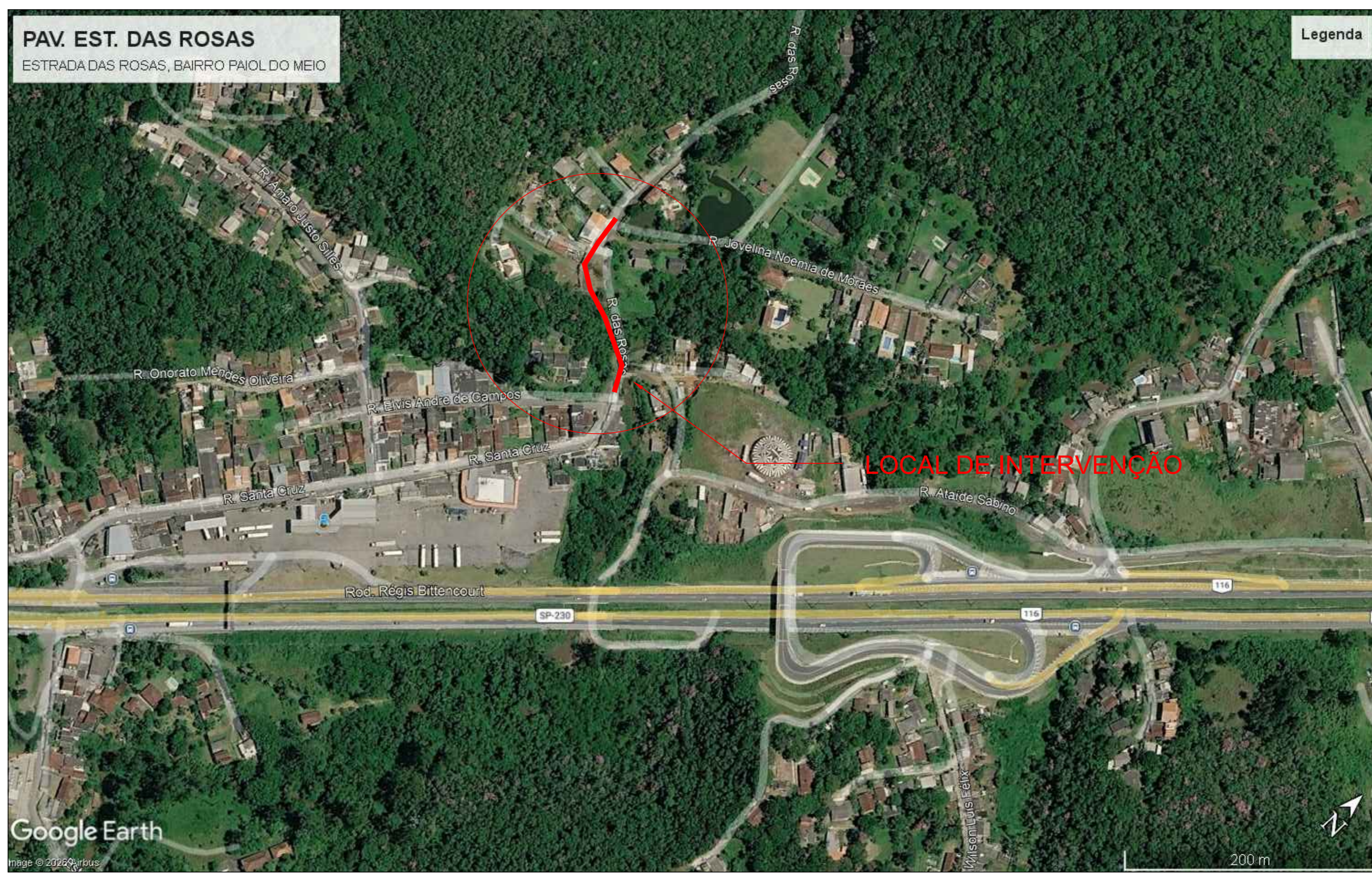
MAPA DE LOCALIZAÇÃO SEM ESCALA