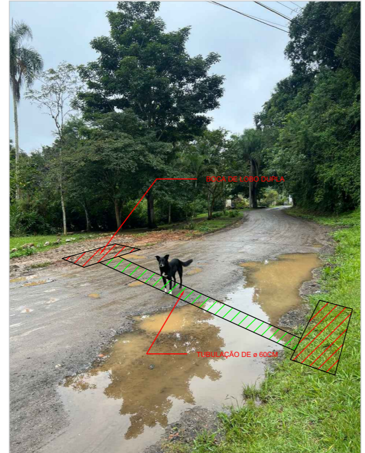
ESTACA 06 LOCAL ONDE SERÁ INSTALADO A DRENAGEM PLUVIAIS