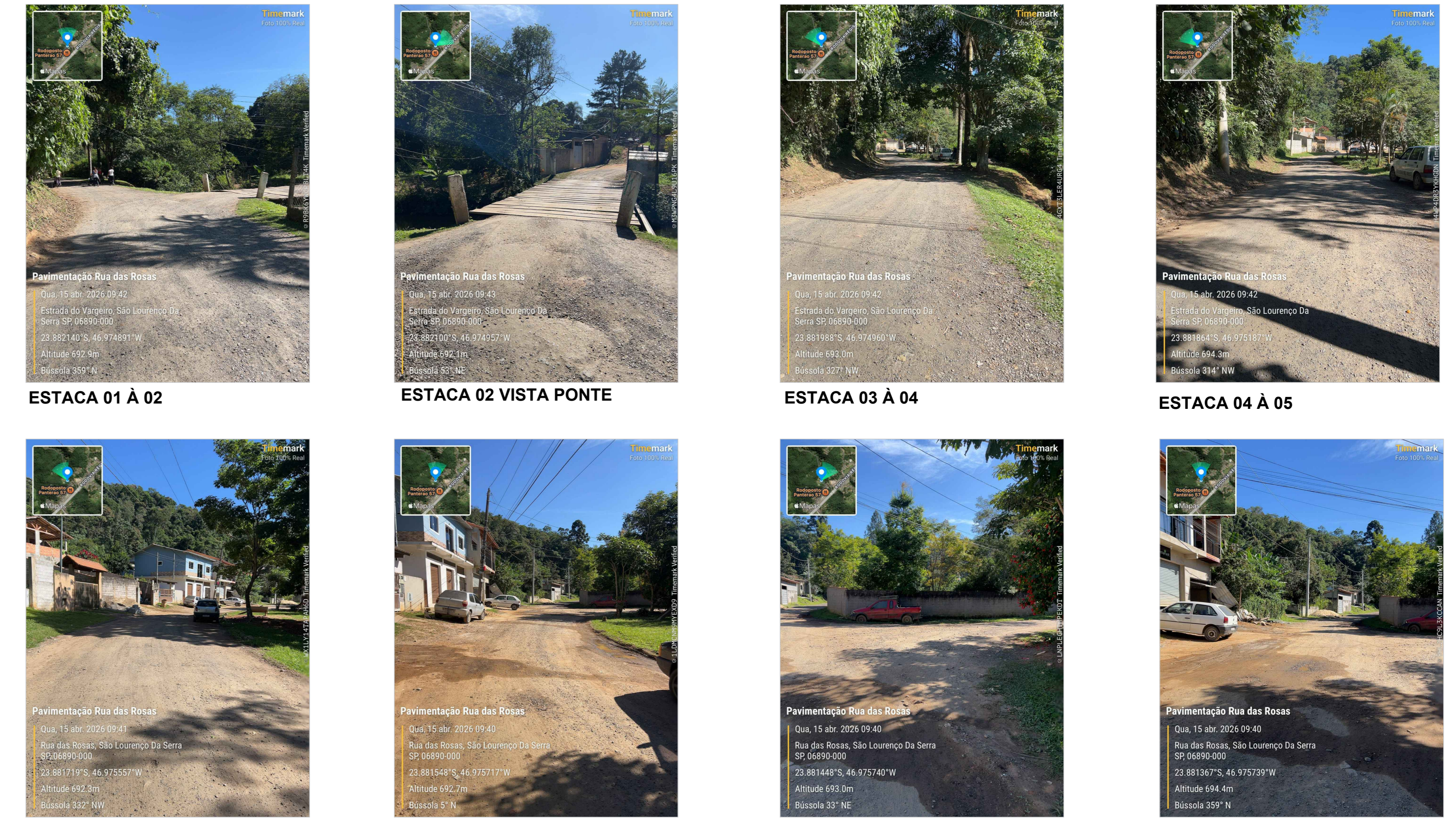
ESTACA 01 À 02