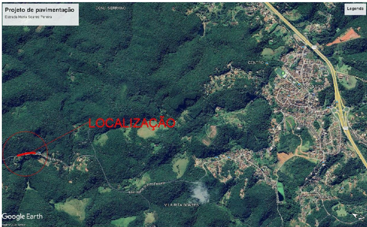
Imagem 1.