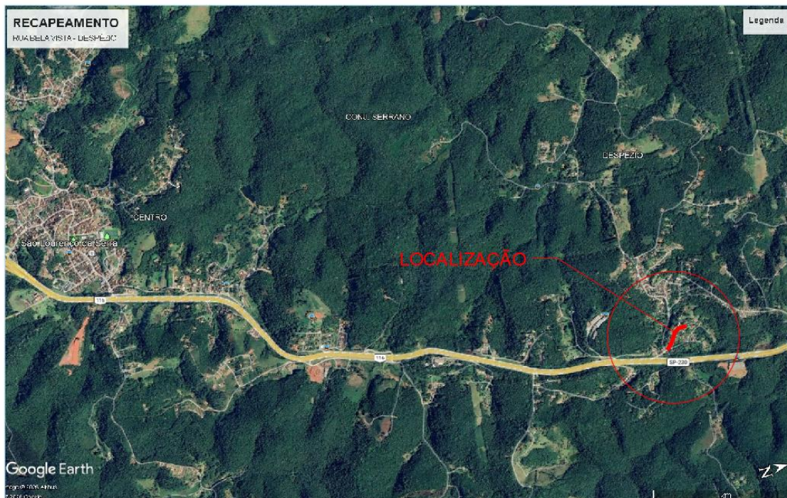
Imagem 1.