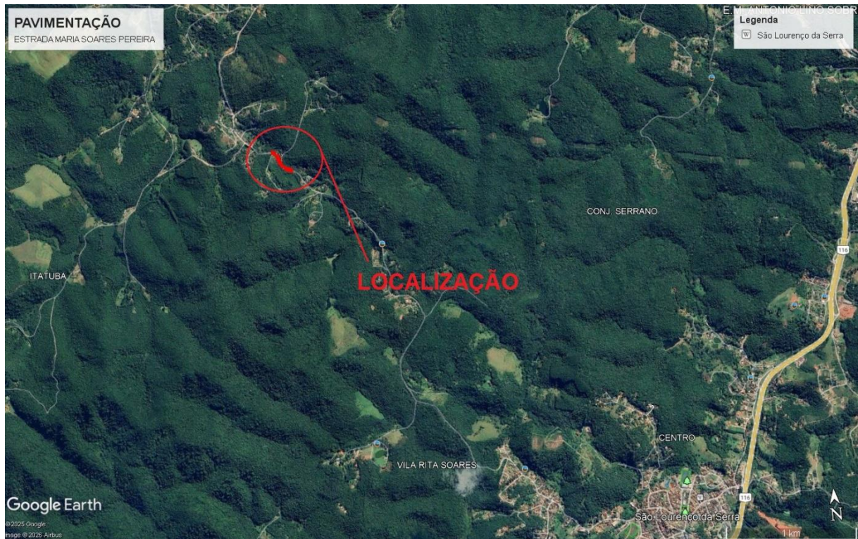
Imagem 1.