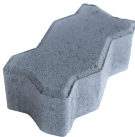
Imagem 3. Modelo do bloco de concreto 16 faces

Todos os serviços deste item deverão ser executados seguindo a sequência lógica de execução de cada etapa, os quais serão supervisionados e somente após aprovação da FISCALIZAÇÃO serão liberados individualmente de modo a dar continuidade a execução das camadas que compõem o pavimento estrutural. O bloco a ser utilizado na pavimentação da via será o do tipo de 16 faces com espessura de 8cm e resistência de 35 Mpa, conforme imagem ilustrativa abaixo.