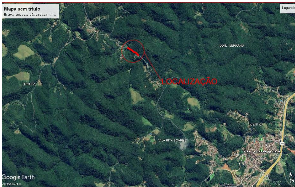
Imagem 1.

A execução de todos os serviços obedecerá rigorosamente às indicações constantes no projeto conforme desenhos, prescrições contidas neste memorial e demais documentos integrantes do contrato.