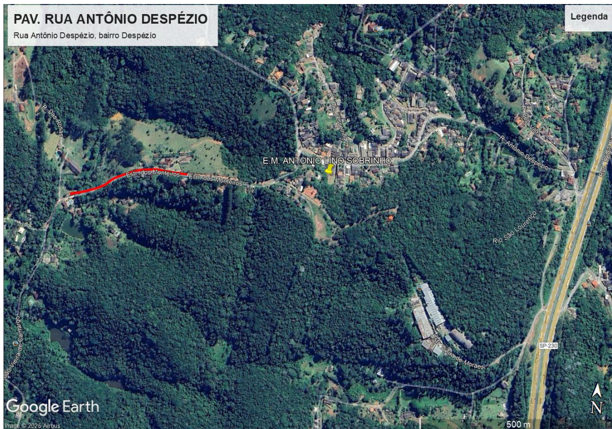
Imagem 1.