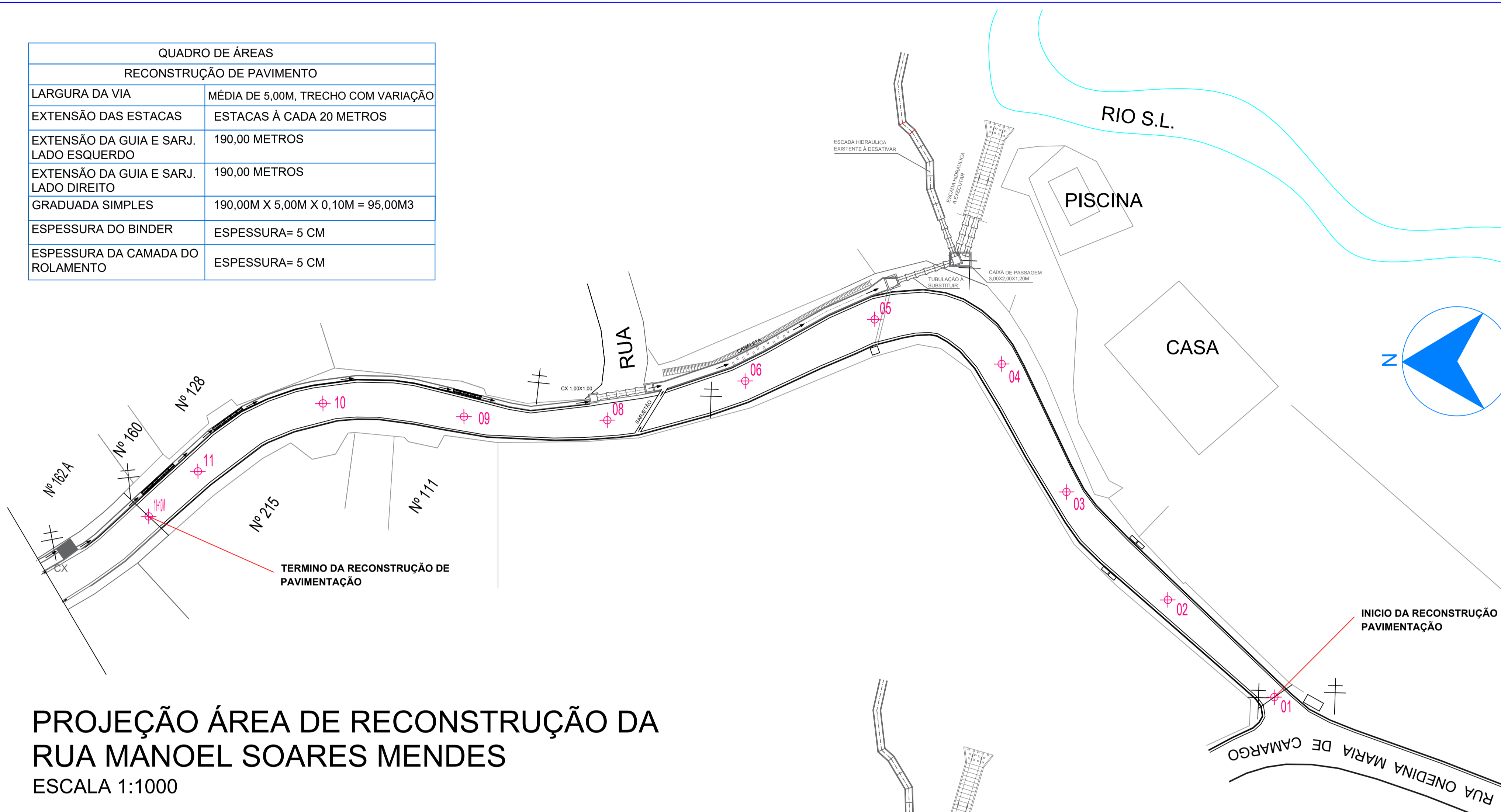
PROJEÇÃO ÁREA DE RECONSTRUÇÃO DA RUA MANOEL SOARES MENDES ESCALA 1:1000